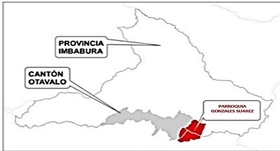
Figura 1. Ubicación geográfica de la Comunidad de Pijal