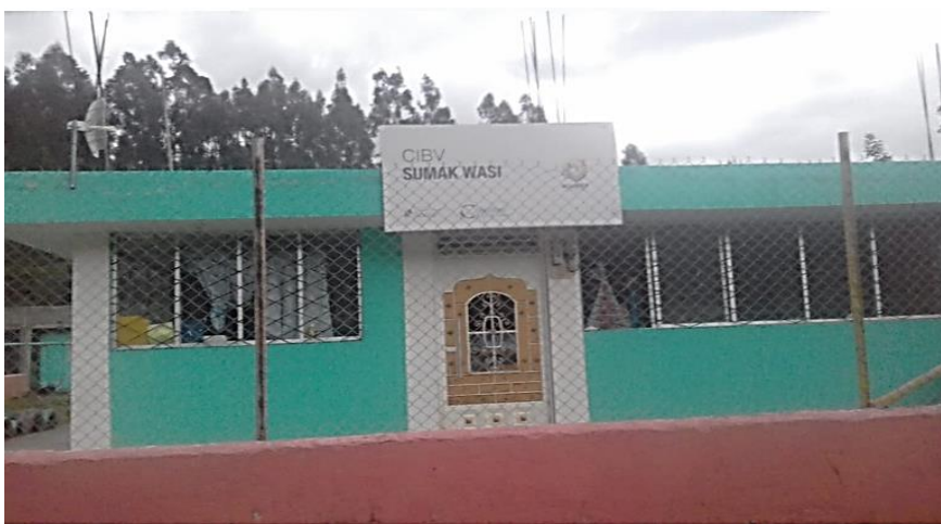
Figura 2. Instalaciones actuales CIBV Sumak Wasi – Comunidad de Pijal